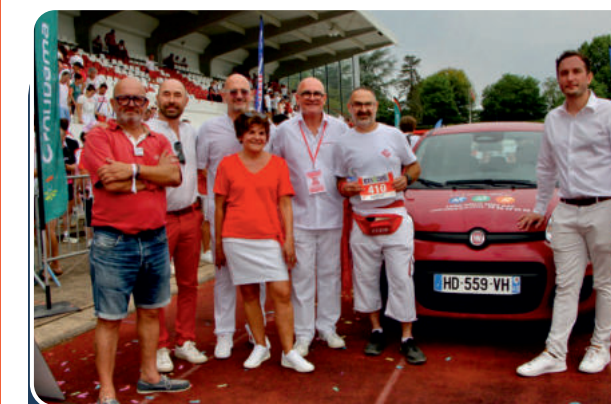
Gagnant 2025 de la Fiat Panda

3 emplacements banderole sur le parcours ou l'Arrivée* Votre logo sur : > le Podium de remise des prix > le dossier Presse, > Brochures quadri, Flyers* > 20000 dépliantes > le site internet + un lien vers votre site > Sur écran géant du stade ou citation de votre marque 1/4 page dans la brochure quadri* Citation speaker de votre marque le jour de la course